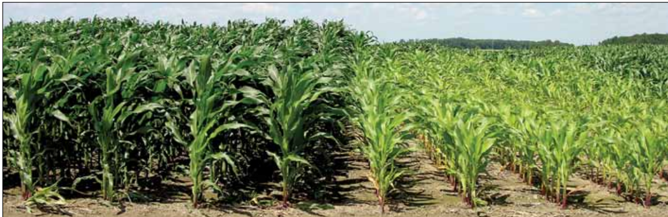
Отзывчивость кукурузы на внесение азотных удобрений на Северо-западной научно-исследовательской станции около Кастара (штат Огайо), в июле 2008 г. Делянка слева получила 269 кг N/га, на делянку справа азотные удобрения не вносились.

Отзывчивость сельскохозяйственных культур на удобрения зависит от погодных условий конкретного года. Потребность сельскохозяйственных культур в элементах минерального питания зависит от погодных условий, и их влияния на процессы поступления элементов питания и их потери из почвы. Для того, чтобы повысить эффективность использования элементов питания из удобрений необходимо разработать методы, позволяющие учитывать влияние погодных условий года на данные процессы.