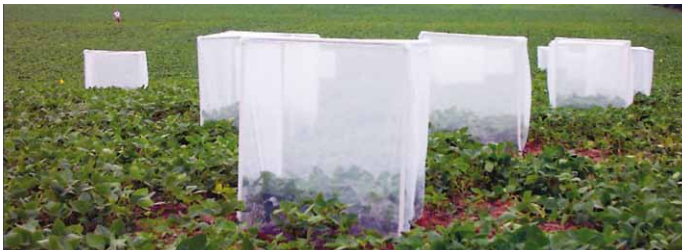
Большие садки (с защитой тли от хищников), которые были использованы для определения скорости роста популяции тли на растениях сои, испытывавших недостаток калия (в варианте без внесения калия в почву) и получивших калийное удобрение. Юго-запад штата Мичиган, июль 2003 г.

Тем не менее, предотвращение недостатка калия у растений – это, по крайней мере, одна из мер защиты от тли и страховка от потери урожая из-за повреждения этим потенциально опасным вредителем, которое к тому же является и переносчиком вирусных и грибных болезней растений. С практической точки зрения это означает, что при возделывании сои необходимо поддерживать плодородие почвы по калию на рекомендуемом уровне, поскольку это является составной частью интегрированной системы защиты растений от соевой тли.