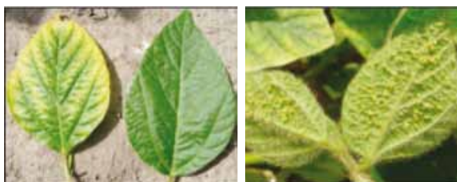
Лист сои при недостатке калия (слева) и здоровый лист, заселенный тлей.

1 Для определения содержания подвижного калия в почве в штате Висконсин используется метод «Брей-1» ( 0.03 M NH_4F + 0.025 M HCl ). Значения ниже 80 и выше 100 считаются, соответственно, низкими и высокими.