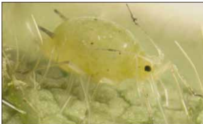
Увеличенная фотография тли ( Aphis glycines Matsumura ).

При этом численность тли и в первый, и во второй год указанного опыта была очень высокой – существенно выше, чем на полях фермеров. Например, в 2002 г. пиковая численность тли на необработанных инсектицидом делянках превысила 1600 особей/растение, а средняя пиковая численность данного вредителя, выявленная при обследовании полей сои в южной части штата Висконсин, составила 280 особей/растение. Возможно, из-за близкого расположения (<0.9 м) и небольшого размера делянок (3.0 x 7.0 м) растения, испытывавшие сильный недостаток калия, привлекали и служили источником пищи для больших популяций тли, что приводило