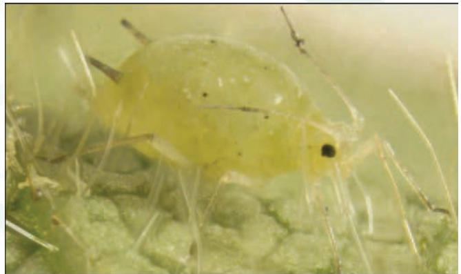
Увеличенная фотография тли ( Aphis glycines Matsumura ).

При этом численность тли и в первый, и во второй год указанного опыта была очень высокой – существенно выше, чем на полях фермеров. Например, в 2002 г. пиковая численность тли на необработанных инсектицидом делянках превысила 1600 особей/растение, а средняя пиковая численность данного вредителя, выявленная при обследовании полей сои в южной части штата Висконсин, составила 280 особей/растение. Возможно, из-за близкого расположения (<0.9 м) и небольшого размера делянок (3.0 x 7.0 м) растения, испытывавшие сильный недостаток калия, привлекали и служили источником пищи для больших популяций тли, что приводило