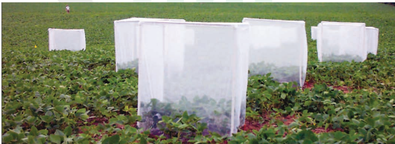
Большие садки (с защитой тли от хищников), которые были использованы для определения скорости роста популяции тли на растениях сои, испытывавших недостаток калия (в варианте без внесения калия в почву) и получивших калийное удобрение. Юго-запад штата Мичиган, июль 2003 г.

Тем не менее, предотвращение недостатка калия у растений – это, по крайней мере, одна из мер защиты от тли и страховка от потери урожая из-за повреждения этим потенциально опасным вредителем, которое к тому же является и переносчиком вирусных и грибных болезней растений. С практической точки зрения это означает, что при возделывании сои необходимо поддерживать плодородие почвы по калию на рекомендуемом уровне, поскольку это является составной частью интегрированной системы защиты растений от соевой тли.