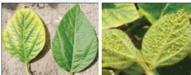
Лист сои при недостатке калия (слева) и здоровый лист, заселенный тлей.

1 Для определения содержания подвижного калия в почве в штате Висконсин используется метод «Брей-1» ( 0.03 M NH_4F + 0.025 M HCl ). Значения ниже 80 и выше 100 считаются, соответственно, низкими и высокими.